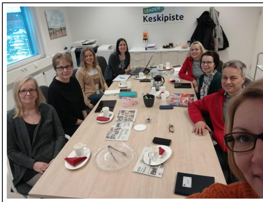
Kuvassa Oulujärvi Leaderin, Ylä-Savon Veturin ja Keskipiste-Leaderin henkilökuntaa vertaisarvioinnin parissa Nivalassa. Toisilta oppiminen on hyödyllistä ja tavoitteena on tehdä muitakin yhteistyötä.

Hakeminen Leader -ryhmäksi ohjelmakaudelle 2021 – 2027 tapahtuu kahdessa vaiheessa. Syyskuun loppuun mennessä jätettävän hakemuksen on sisällettävä mm. toiminta-alueen kuvaus, visio, missio, alustavat painopisteet sekä dynaaminen verkostanalyysi. Toisen vaiheen hakemus jätetään ensi vuonna.