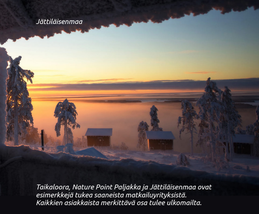
Taikalooora, Nature Point Paljakka ja Jäättiläisenmaa ovat esimerkkejä tukea saaneista matkailuyrityksistä. Kaikkien asiakkaita merkittävä osa tulee ulkomailta.