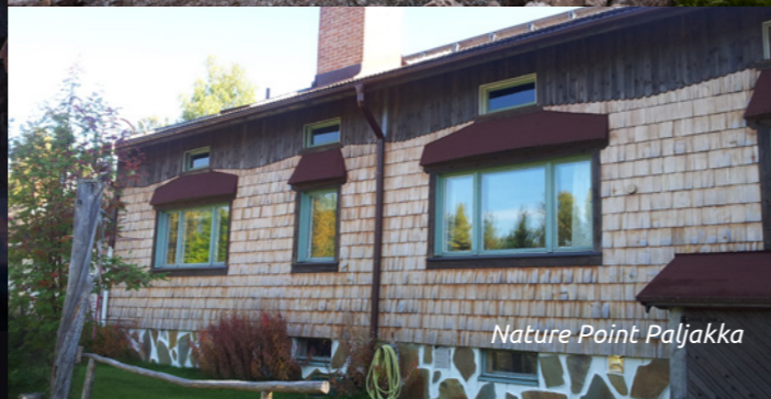
Nature Point Paljakka