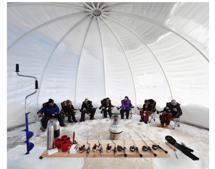
Paljakan sisäkalastusteltta on yksi Kipinärahan avulla syntyneistä uusista palveluista.

Parannettavaa on edelleen muiden rahoituslähteiden hyödyntämisessä. Koko ohjelmakauden ajan on haluttu tehdä hankevalmistelua ja neuvontaa laadukkaasti ja asiakaslähtöisesti sekä luotu ja otettu käyttöön yhdistykselle uusia kehittämistöitä (mm. Kipinä, kymppitonin kokeilut, useita teemahankkeita) ja osallistuttu aktiivisesti eri kehittämisverkostojen työhön. Nämä yhdistettynä lisääntyneeseen hallintotyöhön eivät ole jättäneet tilaa omien, muista rahoituslähteistä haettujen hankkeiden suunnitteluun ja toteuttamiseen. Loppuvuodesta aloitettiin kuitenkin ensimmäisen ESR -hankkeen valmistelu, hakemus on tarkoitus jättää ELY-keskukselle helmikuussa 2019.